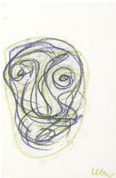
Massimo Mano (CIRCONVOLUTIONS)

/// Exposition CIRCONVOLUTIONS [Collection MADmusée] 21.06 > 9.09.2012 Commissariat : Aloys Beguin – Brigitte Massart ➤ Grand Curtius